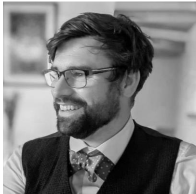
Бретт ЕДВАРДС професор, Університет Бас (Велика Британія)

https://ipacs.knu.ua/?lang=ukr&tip=osn&filtername=&page=2&tipn=News&newsid=2044