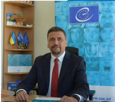
Мачей ЯНЧАК Голова Офісу Ради Європи в Україні

https://ipacs.knu.ua/?lang=ukr&tip=osn&filtername=&page=2&tipn=News&newsid=2085