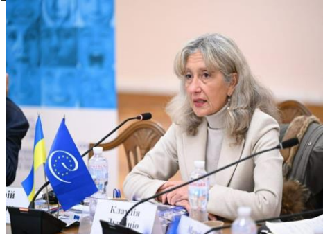
Клаудія ЛУЧІАНІ Директорка з людської гідності, рівності та врядування Ради Європи

https://www.coe.int/uk/web/kyiv/-/new-head-of-the-council-of-europe-office-in-ukraine-1