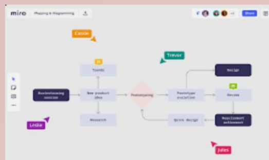
Mindmaps for hybrid work

творча і дружня атмосфера спілкування між викладачами і студентами, де викладачі перебувають на постійному зв'язку зі студентами та консультують з будь-яких питань навчання