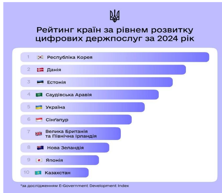
Рис. Рейтинг країн за рівнем цифрових державних послуг за 2024 рік [5].

надання публічних послуг. І якщо у 2022 році Україна посідала 34 місце із 193 у загальному рейтингу цифровізації [3], то у 2024 вона займає вже 5 місце [4].