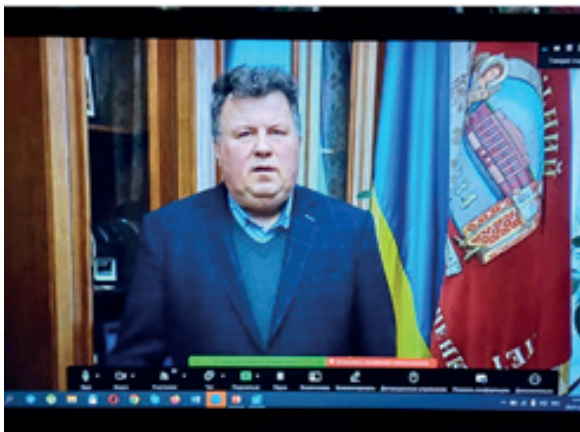
Володимир БУГРОВ, ректор Київського національного університету імені Тараса Шевченка